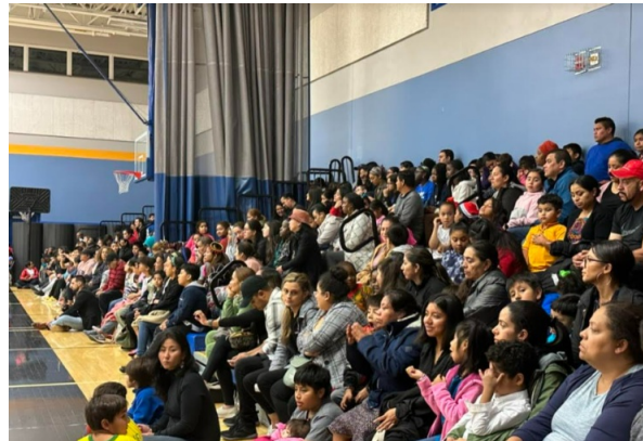
Families came out for Latinx Hispanic Heritage Night!