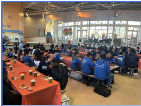
Students who earned Highest Honors enjoyed a celebration breakfast in November!