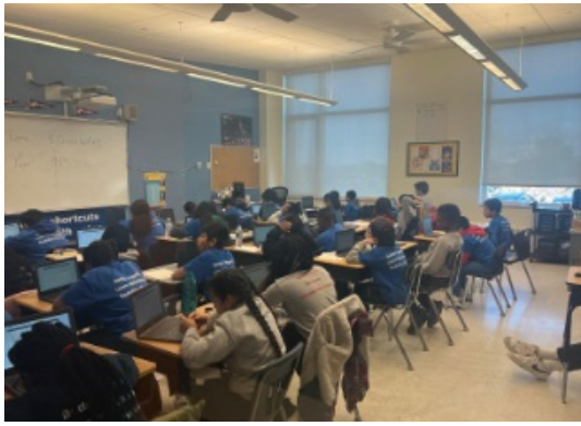
5th Grade students working hard on their MAP assessment the second week of January.