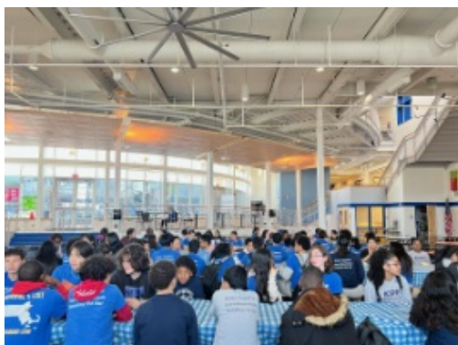
Middle school students enjoying the final High Honors breakfast of the school year.