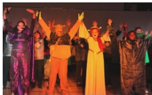
The KAL Drama Club put on an incredible production of Shrek, The Musical Jr!