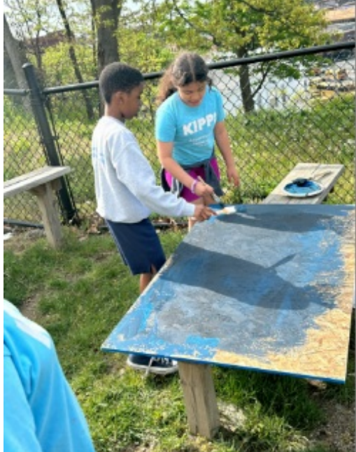
4th graders paint the set for their production of The Lion King, Jr! Come see our 4th graders shine on June 5th!